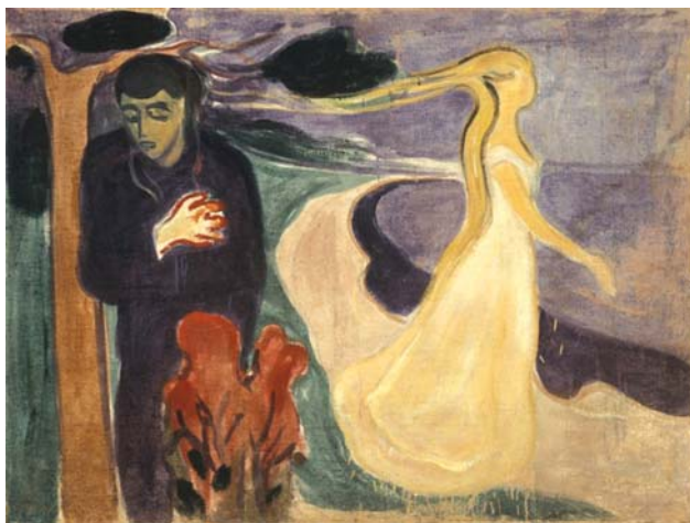
Едвард Мунк. Розставання

теранів війни становить близько 90% [5]. Ці цифри сьогодні мають бути для нас уроком. Вони підкреслюють особливу актуальність діагностики ПТСР на ранніх етапах розвитку та надання пацієнтам належної кваліфікованої допомоги.