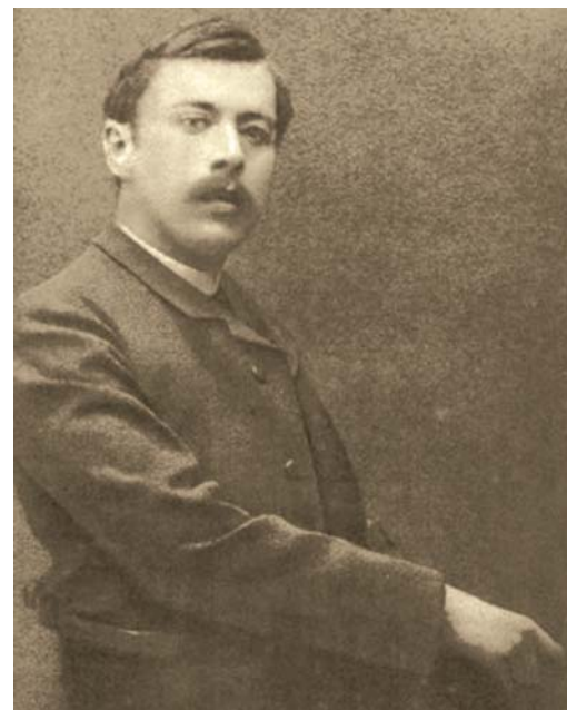
Мунте Аксель Мартин Фредерик (1857–1949) – шведський лікар, письменник