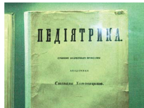
Первое оригинальное российское пособие по педиатрии «Педиятрика»

Появлению «Педиятрики» предшествовал длительный период накопления клинических и теоретических знаний, глубокого их осмысления. Следует сказать, что за период со времени основания Петербургской medico-хирургической академии в 1798 году, когда в России существовало всего лишь семь кафедр, предназначенных для подготовки военных врачей, вплоть до 20-х годов XIX столетия, были созданы отечественные учебные пособия лишь по анатомии и хирургии.