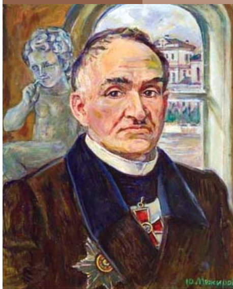
Степан Фомич Хотовицкий (1796–1885)

/Винницкий национальный медицинский университет имени Н.И. Пирогова/