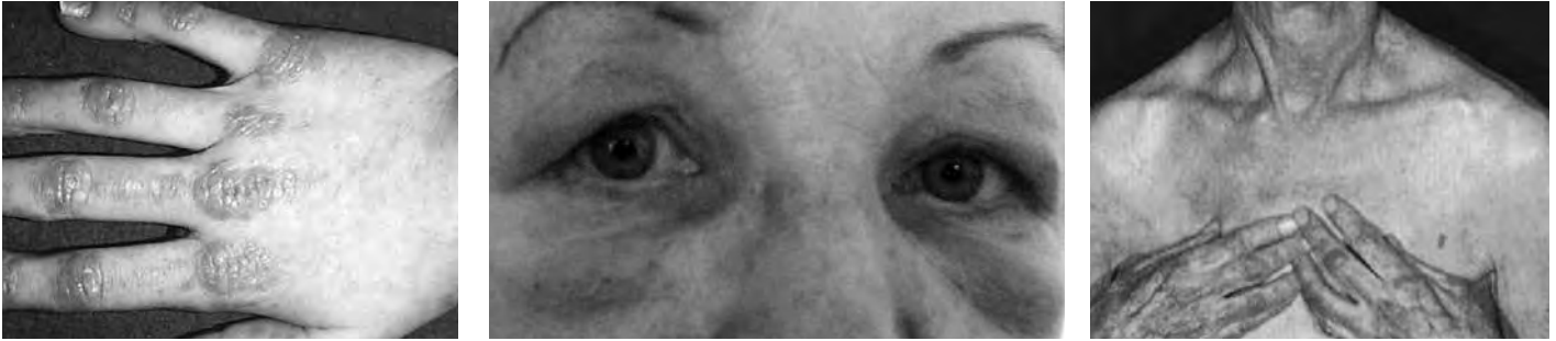
Рис. 4. Синдром Готтрона