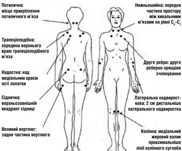
Рис. 3. Тригерні точки при фіброміалгії

Стан хворого найчастіше стабілізується через декілька тижнів, місяців. Відбувається поступове відновлення сили м'язів. Репаративні процеси супроводжуються кальцинозом, атрофією, контрактурами, вкороченням уражених м'язів.